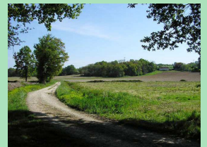
Ombrage et soleil près de Lousalot