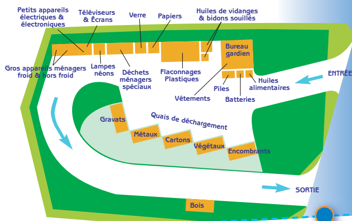
Déchèterie d'Arthez-de-Béarn Z.A. Perrin

100 % recyclable après usage, le verre d'emballage est trié, débarrassé de ses impuretés (colles, étiquettes, métaux) avant d'être broyé en poudre de calcin pour être recyclé dans les fours verriers où il servira à produire de nouveaux emballages en tous points identiques.